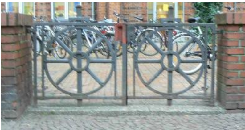
475-jährlicher Devisenkult an der Schule, die Thomas Mann besuchte

Sie hatten sich für ihr Geld eine besondere Fälschungssicherung ausgedacht. Ihr Geld bestand aus Muschelschalhälften, die keiner nachmachen konnte. Dafür hatten sie eine strengbewachte Muschelzucht angelegt. Sie hatten es auch mit Papier versucht und Geldscheine ausgegeben wollen. Aber das Volk sagte: „Der Schein trügt.“