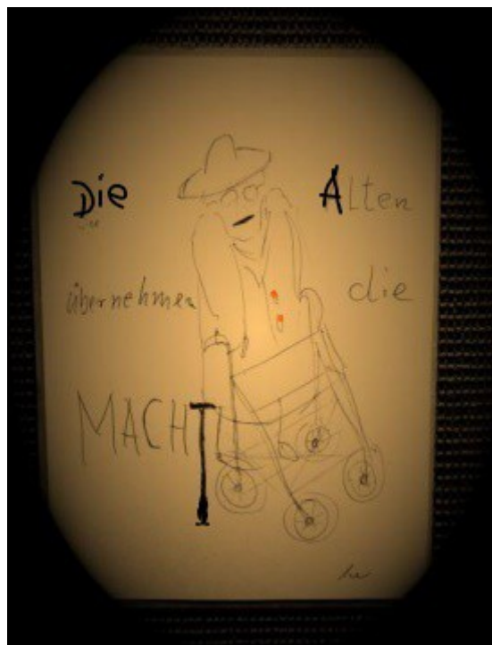
Grafische Antwort zu einer Bild-Kampagne 2008

Die Presse jedoch vermittelt eine andere Dramaturgie! Dass die Dramatik nicht stimmt, dass der demographische Faktor eine niedere Priorität besitzt, dagegen die Bezahlbarkeit der Rente um vieles mehr vom Grad der Beschäftigung und der Produktivität abhängt als von der Bevölkerungsentwicklung - das wird alles nicht dargestellt. Stattdessen liefert die Presse emotionales Material für die Stammtische und beteiligt sich an einer üblen Hetze gegen die Alten.