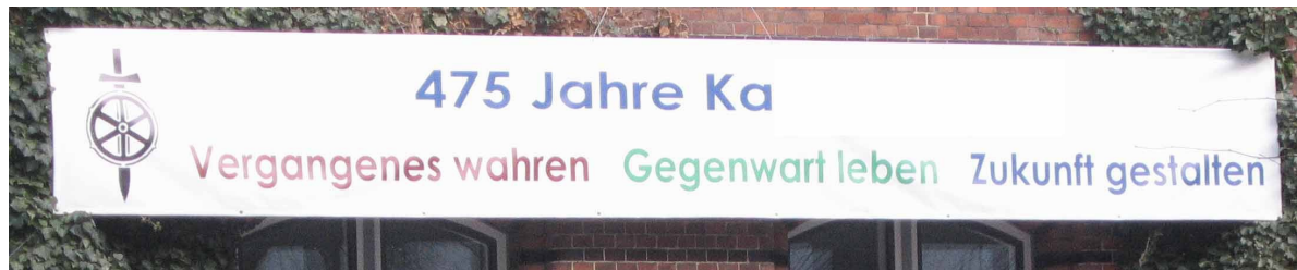
Schwert und Steuerrad

Notfalls mit Raubzügen. Ihre Fahne war mit einem Symbol versehen. Es war ein auf die Spitze gestelltes Schwert mit einem Schiffssteuerrad. Durch dieses Tun vermittelten sie auch gleichsam die Illusion, dass der Markt frei sei und die widersprüchlichste Behauptung der letzten Monopolisten war, dass der Freihandel gefährdet sei. Dieser war aber schon gar nicht mehr vorhanden, weil schon zu viel privatisiert war. Ein Syndrom wurde immer größer. Als man es unter dem Mikroskop noch betrachten konnte, hieß es nur „Nachbarschaftsstreit“.