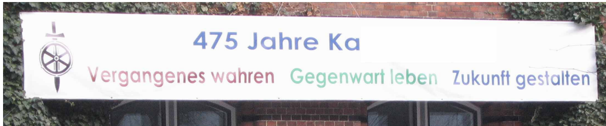
Schwert und Steuerrad

Notfalls mit Raubzügen. Ihre Fahne war mit einem Symbol versehen. Es war ein auf die Spitze gestelltes Schwert mit einem Schiffssteuerrad. Durch dieses Tun vermittelten sie auch gleichsam die Illusion, dass der Markt frei sei und die widersprüchlichste Behauptung der letzten Monopolisten war, dass der Freihandel gefährdet sei. Dieser war aber schon gar nicht mehr vorhanden, weil schon zu viel privatisiert war. Ein Syndrom wurde immer größer. Als man es unter dem Mikroskop noch betrachten konnte, hieß es nur „Nachbarschaftsstreit“.